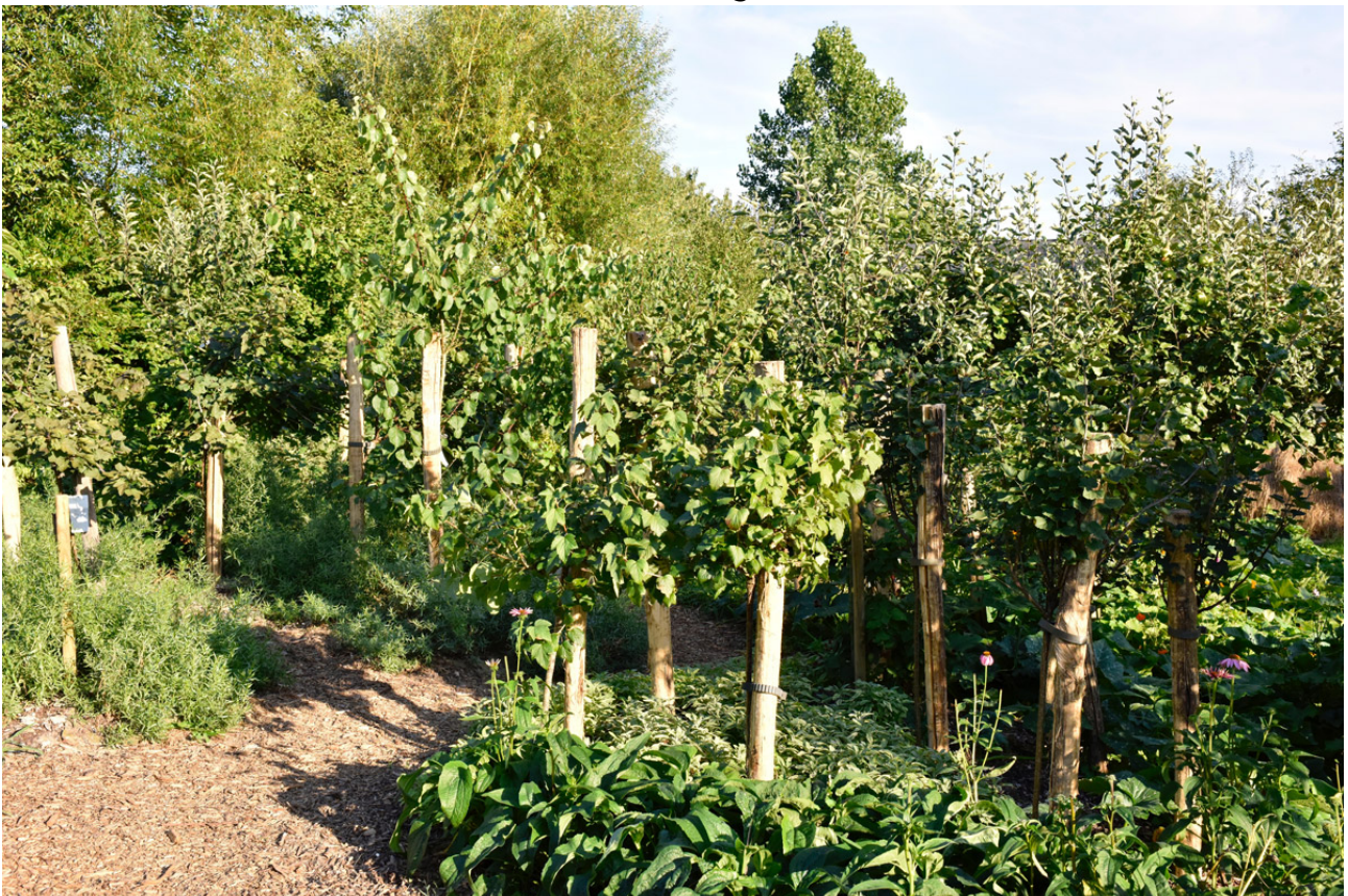
Implantation d'une forêt-jardin a la Ferme du Bec Helloin (27)

C'est l'association de ces 7 strates de culture qui procure à la forêt-jardin sa résilience. En effet, le choix des plantes est effectué en fonction de leurs capacités symbiotiques avec pour buts principaux l'attraction des pollinisateurs, la fertilisation naturelle et le contrôle des maladies et des ravageurs.